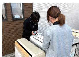
個人のお客様への対応

当社は指定引取場所の運営を開始して4年が経過しました。まだまだ経験が浅く、改善の日々ですが、持込みされる方への挨拶やコミュニケーションを大切にしています。業務においては検品ミス、入力ミスゼロを目指して日頃から尽力しています。