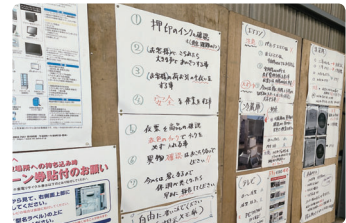
注意喚起やお知らせのポスター