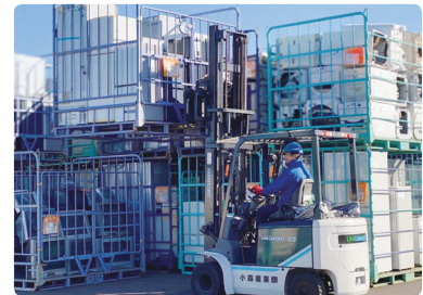
コンテナ段積み作業

事務所では、2名で引き取った廃家電のデータを確認し、正確にデータ入力することを心掛けています。