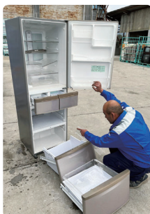
徹底した異物確認

を作成・掲示をして、担当者全員の教育を実施しています。手書きで作成することにより、作成者自身の理解の深掘りができるとともに、各担当者への周知徹底が図れています。