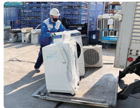
荷降ろし作業の様子